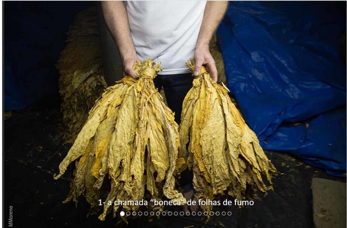
1 - a chamada "boneca" de folhas de fumo ●○○○○○○○○○○○○○○○○○○○○