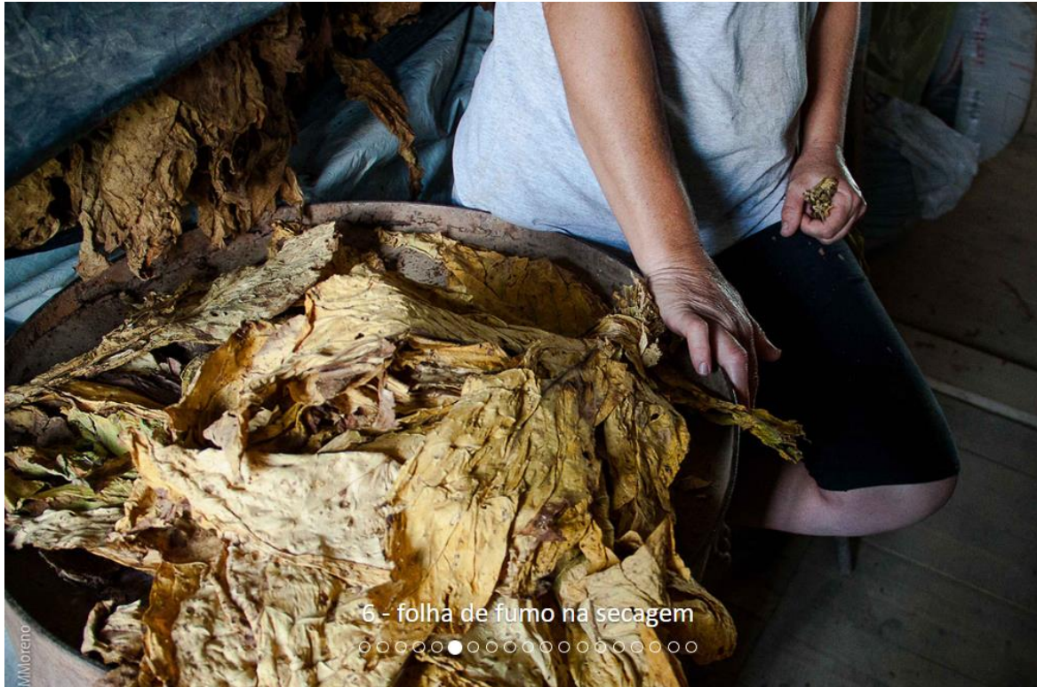
6 - folha de fumo na secagem ○○○○○●○○○○○○○○○○○○○○○○○○